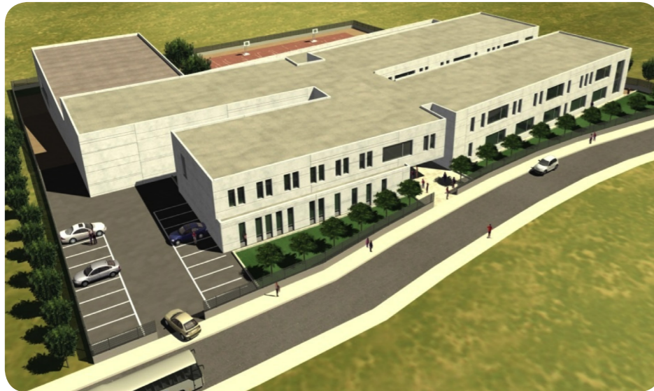
Instituto de Estudios Superiores en Recas, Toledo.