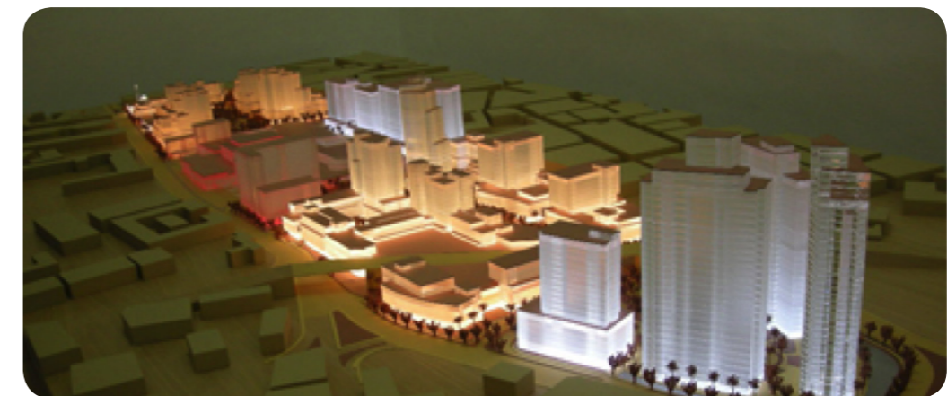
BAB Almadina. Trípoli. Libia Concept Desing.