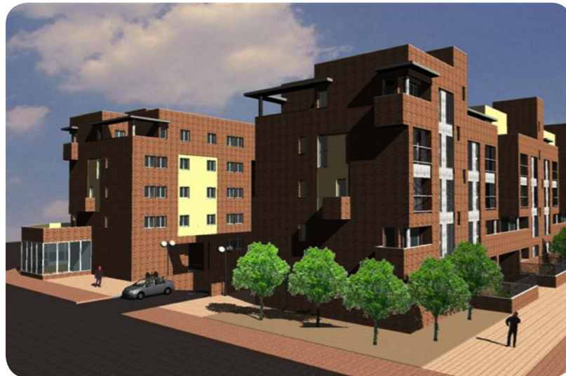
Promoción 116 viviendas VPPK en Soto de Henares, Torrejón de Ardoz.