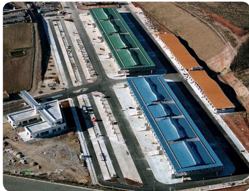
Mercado mayorista. Mercasalamanca.