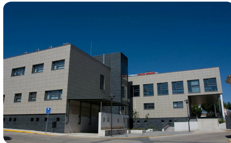
Centro de Salud. Casasimarro.