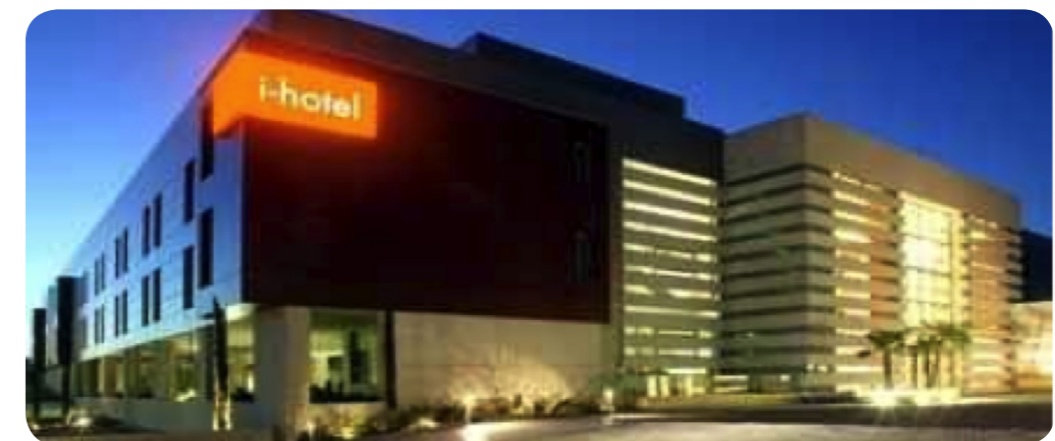
Hotel 4 Estrellas Pozuelo de Alarcón. Madrid.