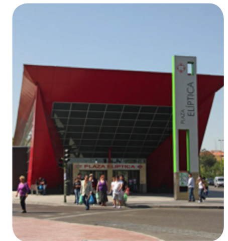
Intercambiadores de Transporte Plaza Elíptica.