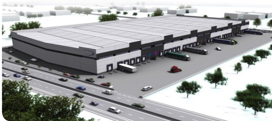
Plataforma Logística INBISA Alovera Guadalajara 18.300 m 2 .