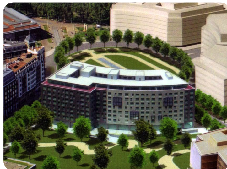
165 Viviendas en Abandoibarra. Bilbao.